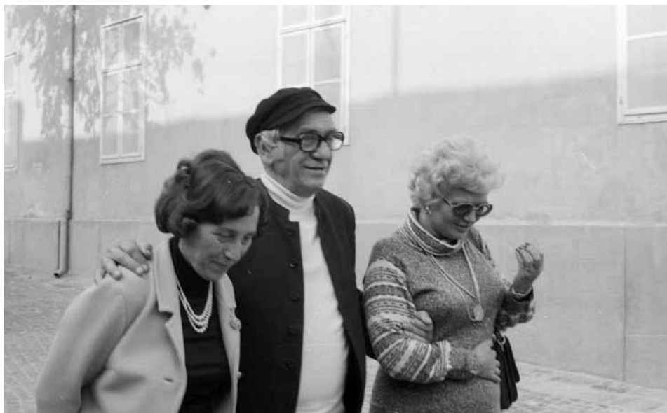
Séta Amerigo Tottal, 1978