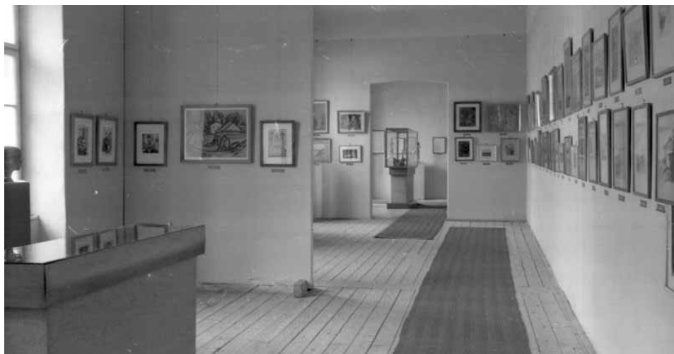
A Képtár kiállítása a Rákóczi út 15-ben, 1962